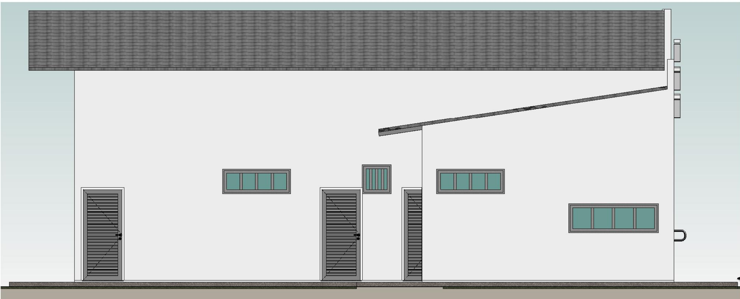
4 ELEVÇÃO ESQUERDA 1 : 50